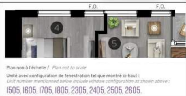
Plan non à l'échelle / Plan not to scale Unité avec configuration de fenestration tel que montré ci-haut : Unit number mentioned below include window configuration as shown above : 1505, 1605, 1705, 1805, 2305, 2405, 2505, 2605.

Les matériaux, superficies et dimensions sont approximatifs et sujets à des modifications sans préavis. Le mobilier est montré à titre indicatif seulement. La superficie brute est calculée en incluant le mur extérieur ainsi que la moitié des murs mitoyens et ceux formant les corridors. Materials, areas and dimensions are approximate and may change without notice. Furniture is shown for illustrative purposes only. Unit area is obtained by including exterior walls as well as half of both demising and corridor walls.